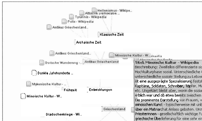
Abb. 2 Ein Ausschnitt der Zielhierarchie als Wissensnetz. Querverbindungen durch Tags und identische URLs werden durch farbliche Kennzeichnung hervorgehoben. Zu der ausgewählten Ressource wird eine Beschreibung als Tooltip angezeigt (Textbox rechts unten).

Während des Browsens durch Webressourcen können diese in den Zielbaum an der markierten Stelle eingefügt werden. Die Ziele und Ressourcen können auch nach dem Anlegen bearbeitet werden.