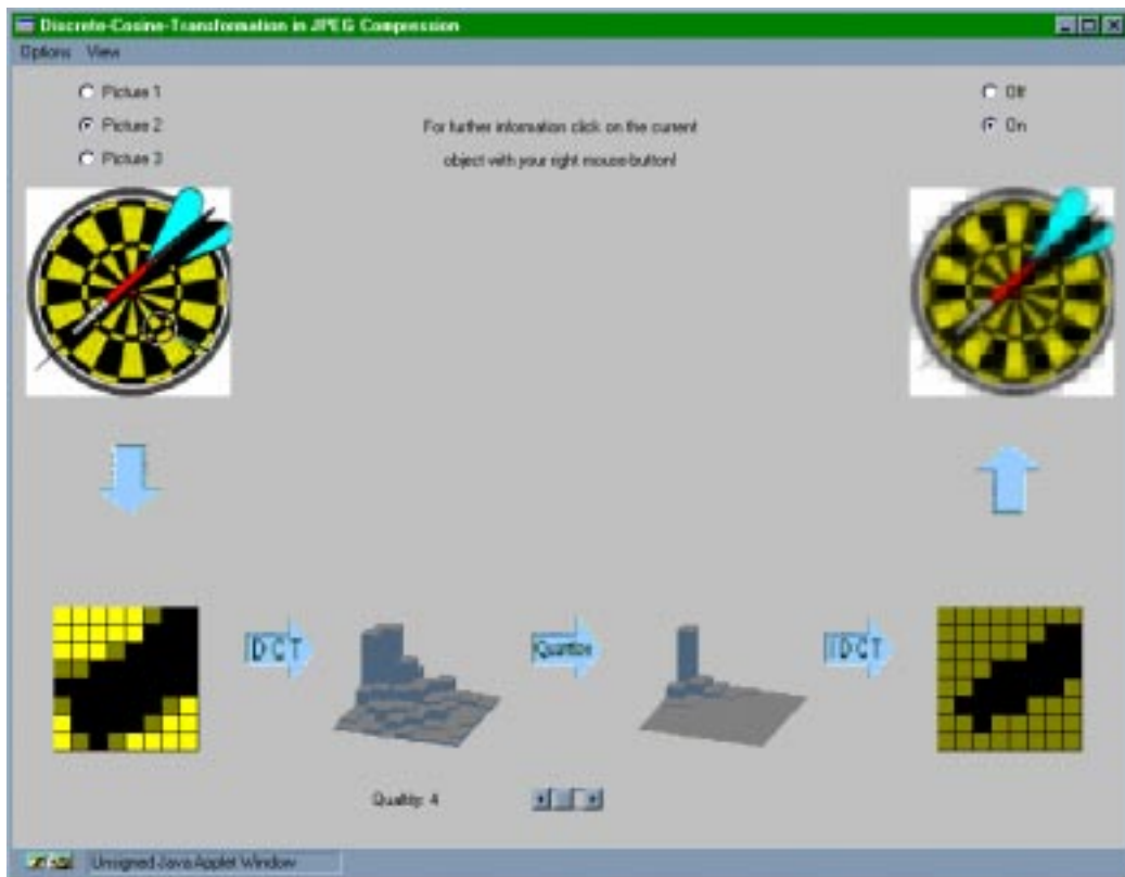
Abbildung 2: Das Hauptfenster des DCT-Applet

Durch diese Interaktivität in der Lehre und die anschaulichere Darstellung läßt sich das Wissen viel besser und interessanter vermitteln. Vielen Studenten ist erst durch dieses Programm klar geworden, warum es bei den bekannten JPEG - Algorithmen zu einer Blockstruktur des komprimierten Bildes bei hohen Kompressionsraten kommt. Die entstandenen Anwendungen haben gezeigt, daß eine interaktive Lehre mit Java nicht nur möglich, sondern auch sinnvoll ist. Die Studenten, die diese Programme testeten, äußerten sich durchweg positiv.